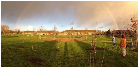
Figuur 2 "eetbare" park

De Taka-TukaTuin is gerealiseerd door een actieve groep betrokken bewoners. Vrijwilligers onderhouden de tuin. Al langere tijd is er een samenwerking met zorginstellingen als Pameijer en Orion voor het gezamenlijk tuinieren voor mensen met een beperking: zij ondersteunen de tuingroep (vrijwilligers/bewoners). In 2019 wordt een samenwerking voorbereid met basisscholen voor educatie: van zaadje tot op je bordje. Ook worden contacten gelegd met peuterspeelzalen en naschoolse opvang voor activiteiten in het gebied.