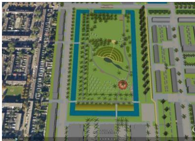
Figuur 1 Manifestatieveld

Wollefoppengroen & Co heeft in 2013 en 2014 een groot "eetbaar" park op het Manifestatieveld in de wijk Zevenkamp (Rotterdam) aangelegd. Dit "eetbaar" park bestaat momenteel uit een marktplaats, fruitbomen, bessenstruiken, bijenkasten en een stadslandbouwtuin op basis van permacultuur. In 2018 is de 1 e fase van een ontmoetingsgebouw (casco) gerealiseerd.