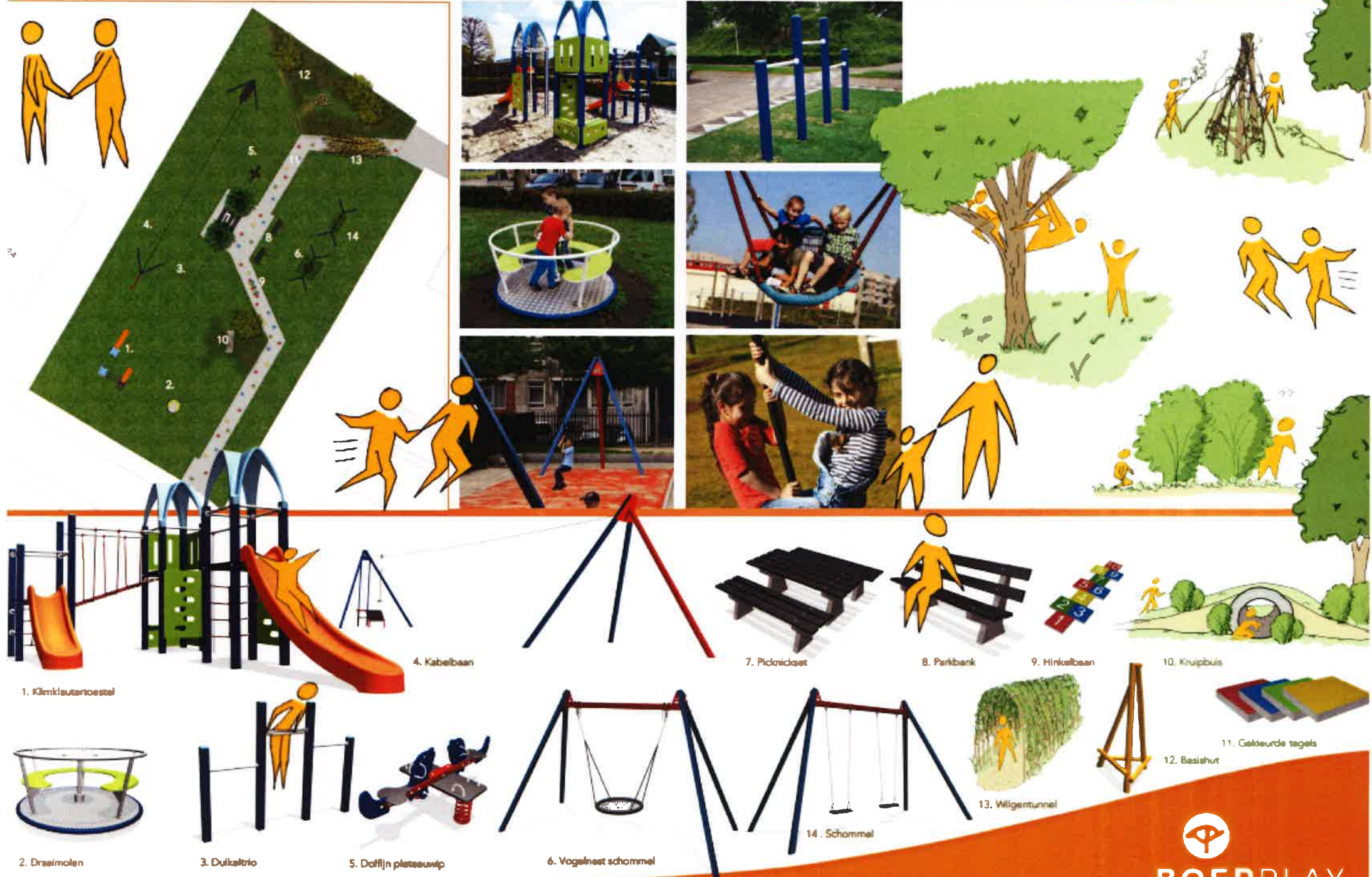
1. Klimklauter met glijbaan