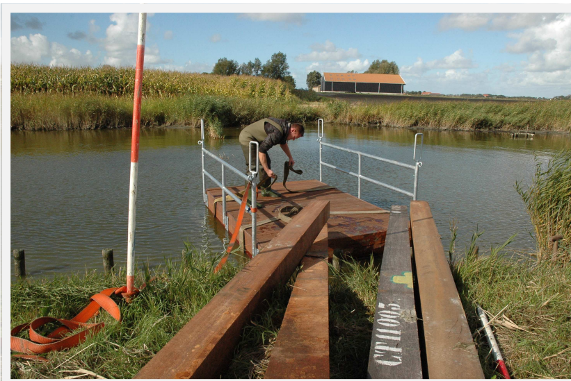
Aanleg pontje in volle gang, 8 oktober 2012