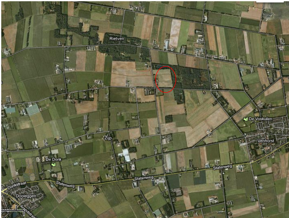
Figuur 1: Locatie uitbreiding Voskuilenheuvel

(Bron: gesprek Jan van Melis voormalig eigenaar van de '60-er tot '90-er jaren van de 20 e eeuw). De uitbreiding van Voskuilenheuvel ligt ten westen van het huidige Peellandschapspark en ten zuiden van visvijver De Boekhorst (figuur 1). De uitbreiding is circa 6 hectare groot. Het perceel is in de eerste helft van de 20 e eeuw ontgonnen. Het perceel is echter pas in de jaren '70 van de vorige eeuw geëgaliseerd. Dat is erg laat, aangezien de boerderij op de voormalige huiskavel reeds in 1932 is gebouwd. De oorzaak van de late egalisering lag aan de bijzondere geomorfologie van het perceel. Het perceel kenmerkte zich door horsten en dalen op een zeer korte afstand. Vanuit de laagste delen kon men nauwelijks over de Schepersdijk heen kijken. Dwars over het perceel liep een hogere rug. Het midden van de deze rug werd gevormd door een horst die circa 4 meter hoger was dan het gemiddelde maaiveld. Een indruk van de oorspronkelijke maaiveldhoogte is nog te krijgen door te kijken naar de grotere bomen aan de rand van de Voskuilenheuvel en op de wal aan de zuidzijde van de visvijver. Het maaiveld bij deze bomen geeft een goede indruk van de oorspronkelijke glooiing van het perceel.