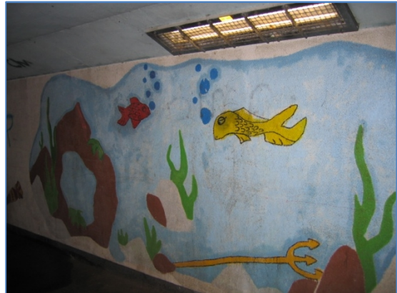
De schilderijen in de tunnel als aangebracht in 1994