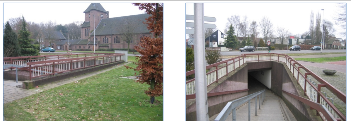
De aanblik van de tunnel in de huidige situatie met het hek en de toegang naar de tunnel (vanaf kerk)

Het dorp Mariënheem wordt doorkliefd door de N35. De school en de kerk en enkele woningen zijn gelegen aan de zuidzijde van de weg. Het overgrote deel van de bebouwde kom en verschillende voorzieningen zijn gelegen aan de noordzijde van de weg. Bewoners moeten de weg veelvuldig oversteken. Het verkeersaanbod is sterk toegenomen. In de 70-er jaren van de vorige eeuw is de tunnel aangelegd in Mariënheem als mogelijkheid om de N35 te kunnen oversteken. De ruimte was destijds en is nog steeds beperkt. Gevolg is geweest, dat er een tunnel is aangelegd met aan weerszijden trappen en naast de trappen een fietsgoot. Gebruikers moeten de fiets aan de hand meenemen door de tunnel. Gevolg is geweest een altijd beperkt gebruik van de tunnel.