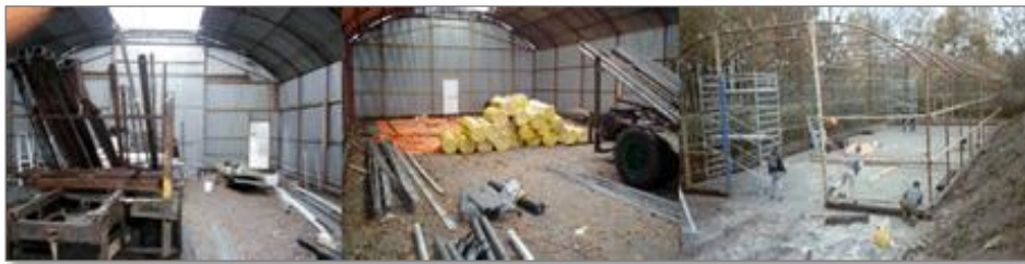
De bouw van de tijdelijke nishut in 2002

In 2003 is de stichting opgericht door een aantal leden van de Jongerenvereniging De Barbiertjes. De Barbiertjes zijn vooral bekend van hun optredens tijdens de carnavalsoptochten. Maar ze doen nog veel meer zoals de jaarlijkse zeskamp, het feestweekend “Blaal barst los en uit je Plaat” dat inmiddels letterlijk helemaal uit z'n voegen barst, een bijdrage aan de organisatie van Neterpop en het ondersteunen van activiteiten bij andere instelling of verenigingen. Het is dus een echte jeugdvereniging die behoefte had en heeft aan een eigen onderkomen. Dit hebben ze geregeld in de vorm van de stichting Onderkomen Neterselse Verenigingen. Een stichting die als doel heeft een permanent gebouw te bouwen nabij het sportpark van Netersel. Momenteel wordt nog gebruik gemaakt van een tijdelijk onderkomen (Nishut).