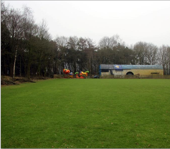
Korfbalveld met aan het einde de oude nishut