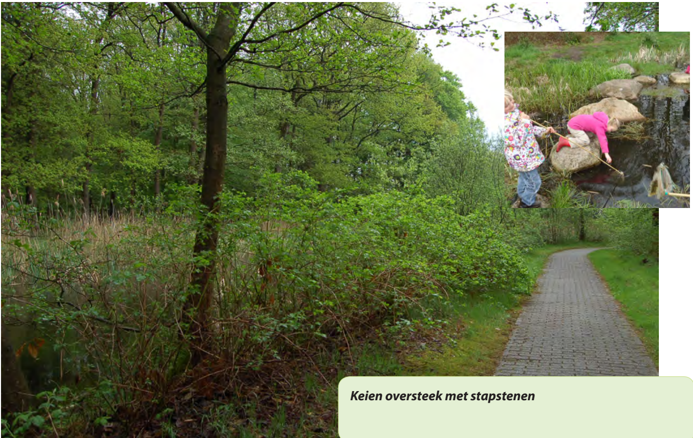
Keien oversteek met stapstenen