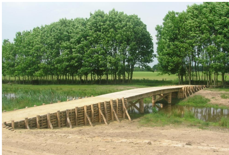
Romeinse brug, voor en na realisatie.