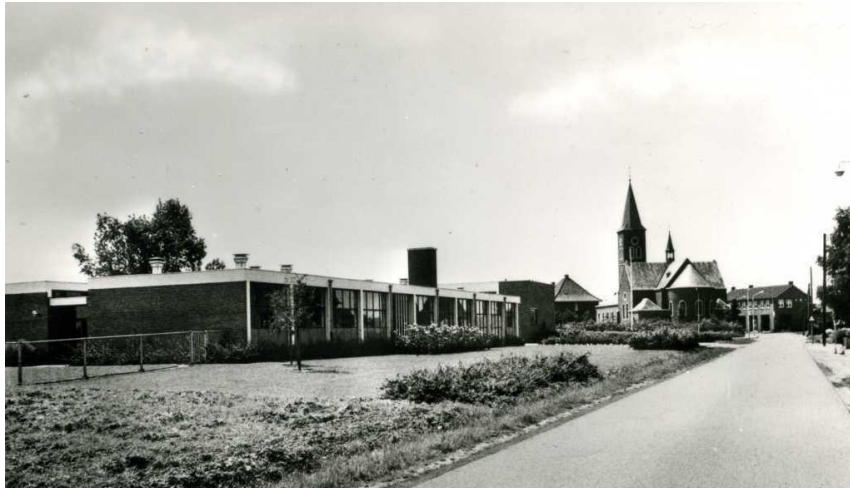
Lagere Huishoud- en Nijverheidsschool

In 1967 werd na het nodige heiwerk, gestart met de bouw van de Lagere Huishoud- en Nijverheidsschool. Op 1 september 1968 werd de school officieel geopend. Veel jonge meiden uit Tungalroy en omgeving leerden op deze school koken, wassen, strijken en andere huishoudelijke vaardigheden.