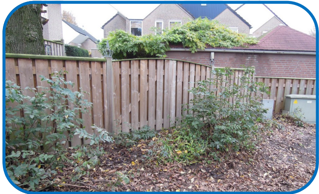
Hier komen 2 parkeerplaatsen

Door een chronisch gebrek aan parkeerruimte is in deze buurt van ca. 60 huizen veel overlast van geparkeerde auto's; daardoor ontstaan irritaties en onveilige situaties op straat. Samen met Gemeente, Wonen Limburg, Synthese en Veilig Verkeer Nederland is door 2 werkgroepen met in totaal 12 personen gewerkt aan het inventariseren en oplossen van deze problemen. Er is nu door de Gemeente een GO-beslissing genomen voor een voorlopige uitbreiding met 8 parkeerplaatsen, dit na draagvlak verkregen van aanwonenden van Weg in den Berg. Bij het verschijnen van deze editie zal het resultaat al zichtbaar zijn.