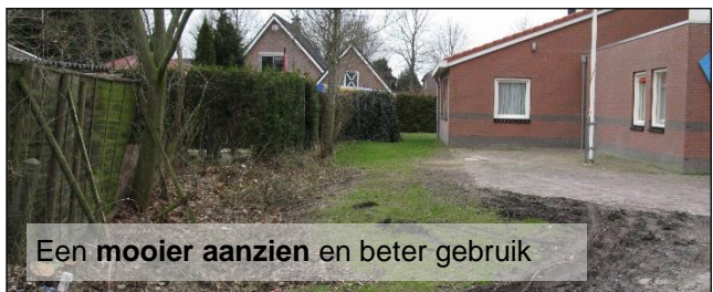
Een mooier aanzien en beter gebruik