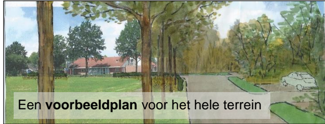
Een voorbeeldplan voor het hele terrein