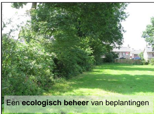
Een ecologisch beheer van beplantingen