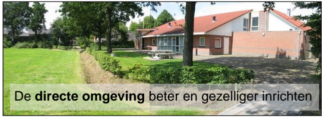
De directe omgeving beter en gezelliger inrichten