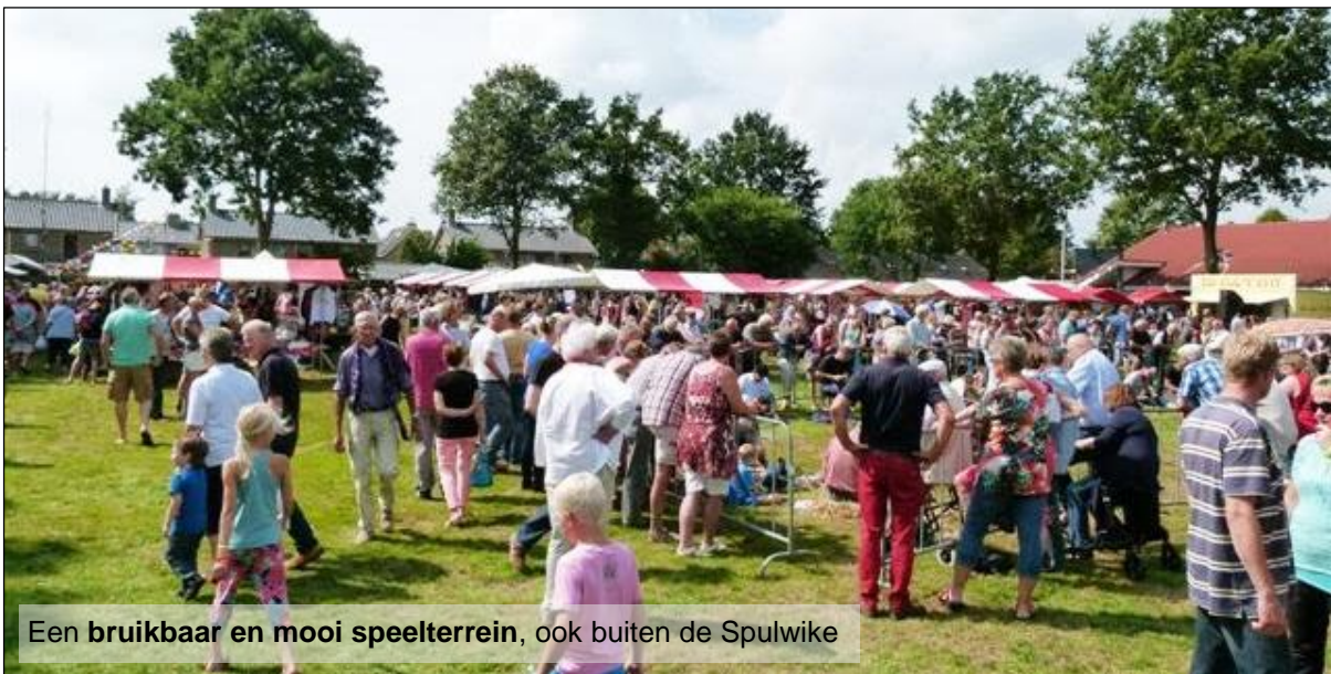
Een bruikbaar en mooi speelterrein, ook buiten de Spulwike