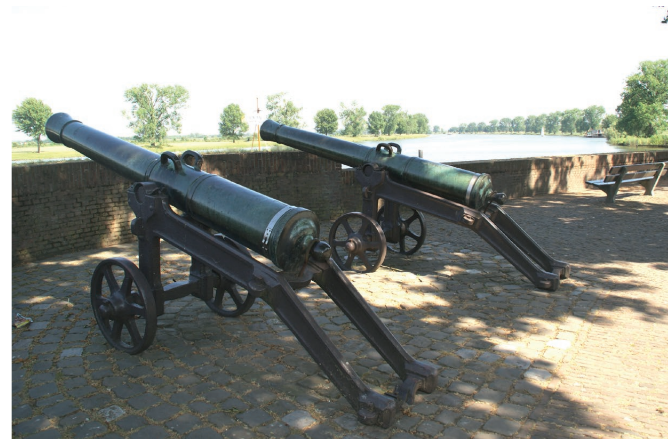
Kanonnen Maaskade Grave

Op de Maaskade in Grave staan twee bronzen kanonnen die zijn gemaakt in 1778 en 1787. Tot 1930 werden deze kanonnen afgeschoten als waarschuwing dat binnen één dag de "Beerse Overlaat" in werking zou treden. Het kanonschot was een teken voor de boeren om het vee binnen te halen.