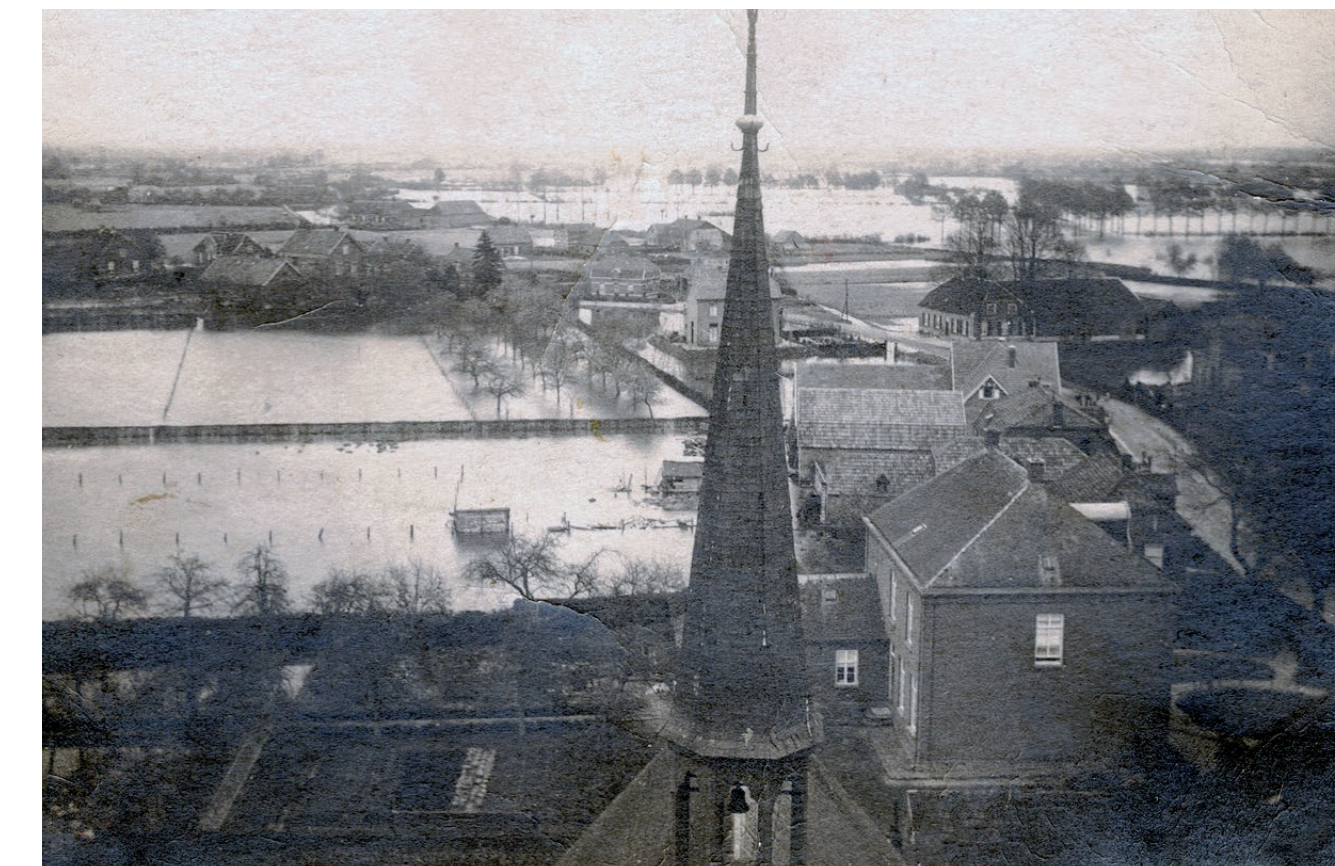
Overstroming in Beers