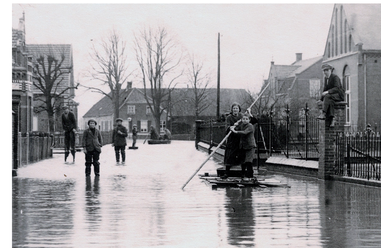
Overstroming in Beers