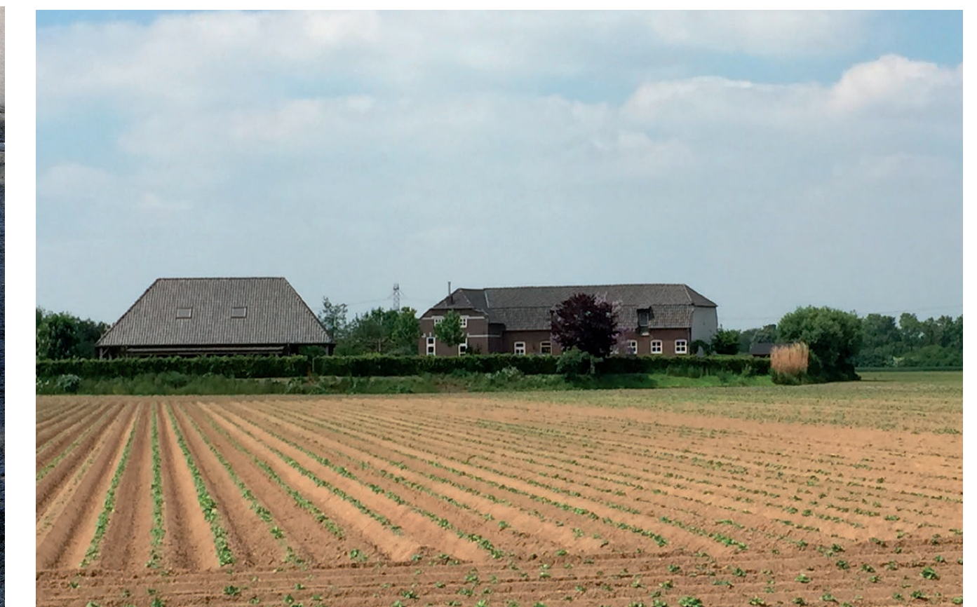
Terpwooning 'De Brunkum'