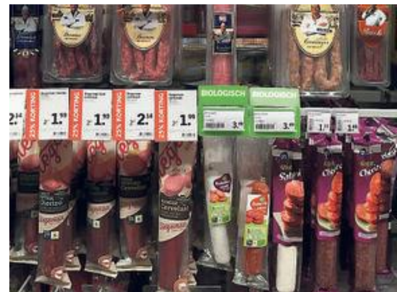
... en overall plastic. Ook om biologische producten.

scheept naar landen als India waar ze er ook geen raad mee weten.” Zelf kopen de vrouwen ook boodschappen met plastic erom. „Je wordt gewoon gedwongen, het kan bijna niet anders. We moeten het met z'n allen veranderen, maar het voortouw moet genomen worden door de grote bedrijven.” Enkele klanten beamen dat 'het van de gekke is' met al dat verpakkingsmateriaal, de bedrijfsleider heeft respect voor het ideaal. Aan achtergelaten verpakkingen opruimen zijn ze trouwens al een beetje gewend. „Veel mensen halen hier al de doos van hun pizza af.”