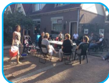
Met elkaar een bakkie doen

'Voor sfeer & kleur!' TUIN DIER HUIS TUINCENTRUM DEN HELDER