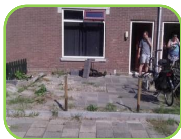
Voordat we begonnen

Na afloop hebben we lekker Chinees gegeten en veel gelachen met elkaar. Een heel geslaagde dag. Alle bewoners die meegeholpen hebben hartelijk dank.