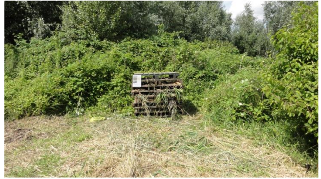
Muizenruiters, bijenhotels, het wordt divers op de Hooge Nesse.