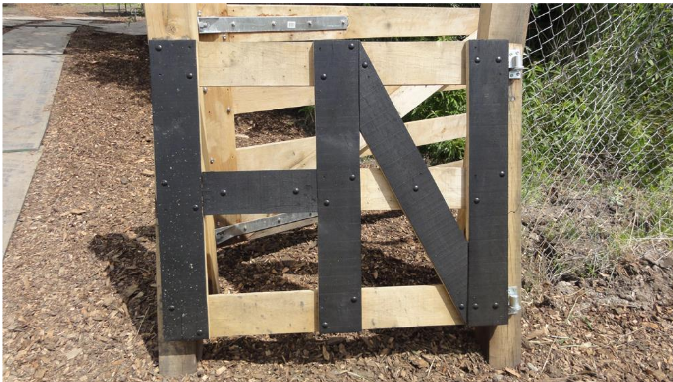
HN – Hooge Nesse

Gloednieuwe borden en een nagelnieuw hek nodigen uit om een onverwachte natuurbeleving te ondergaan. Het gebied is verrassend. Kom gerust zelf kijken en neem fotoestel en verrekijker mee.