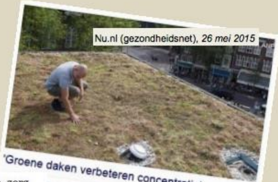
Nu.nl (gezondheidsnet), 26 mei 2015

Er zijn meerdere mogelijke verklaringen. Een fysiek voordeel van bijvoorbeeld stof, en gezonde mensen werken bij kantoordecoratie de indruk wekt dat het management waarde hecht op de hardere willen werken.