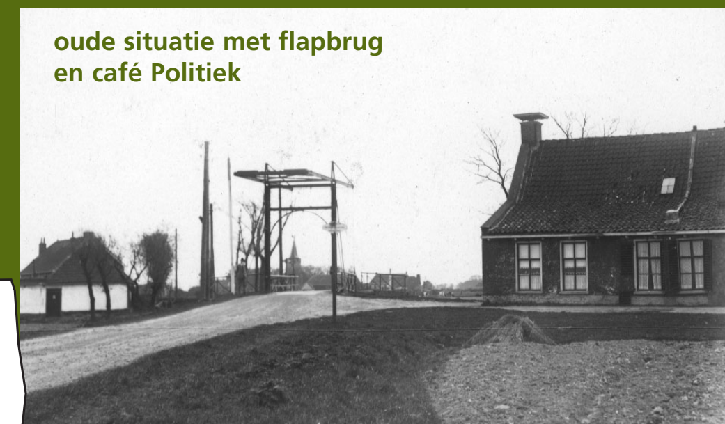
oude situatie met flapbrug en café Politiek

Een krantenbericht uit 1896 over café Politiek. Het dorpscafé had vroeger een belangrijke functie. Als ontmoetingsplaats, de plaats waar het loon werd uitbetaald, maar ook bij de organisatie van evenementen. Aan weerszijden van de Arumervaart bij de brug (voorheen de doorgaande weg) stonden er zelfs twee. In 2000 is het laatste dorpscafé van Hitzum gesloten.