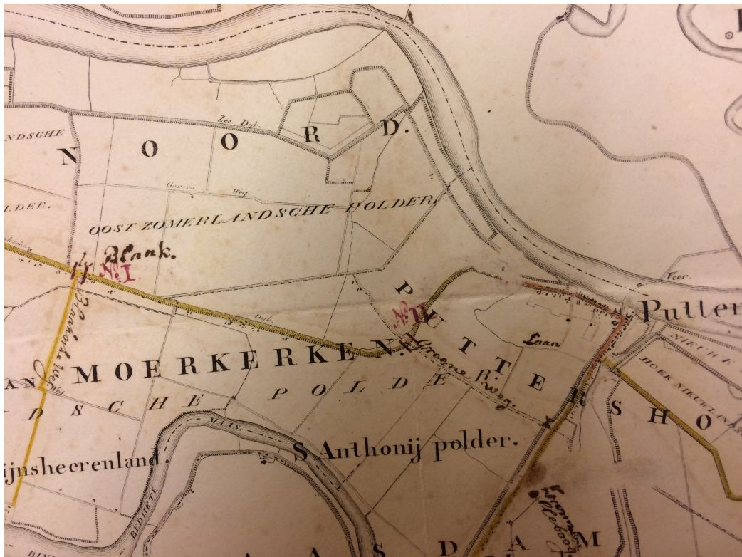
Afbeelding 5: Kaart met in 1841 beschulpte wegen (geel) en voorstel voor tolposten (rood)

Deze weg ontmoet bij Goidschalxoord de route komende uit Numansdorp en gaat dan verder via het Rhoonse Veer naar Katendrecht. Deze structuur blijft lang behouden zoals te zien op een kaart uit 1915 (afbeelding 6). Ondertussen is in 1888