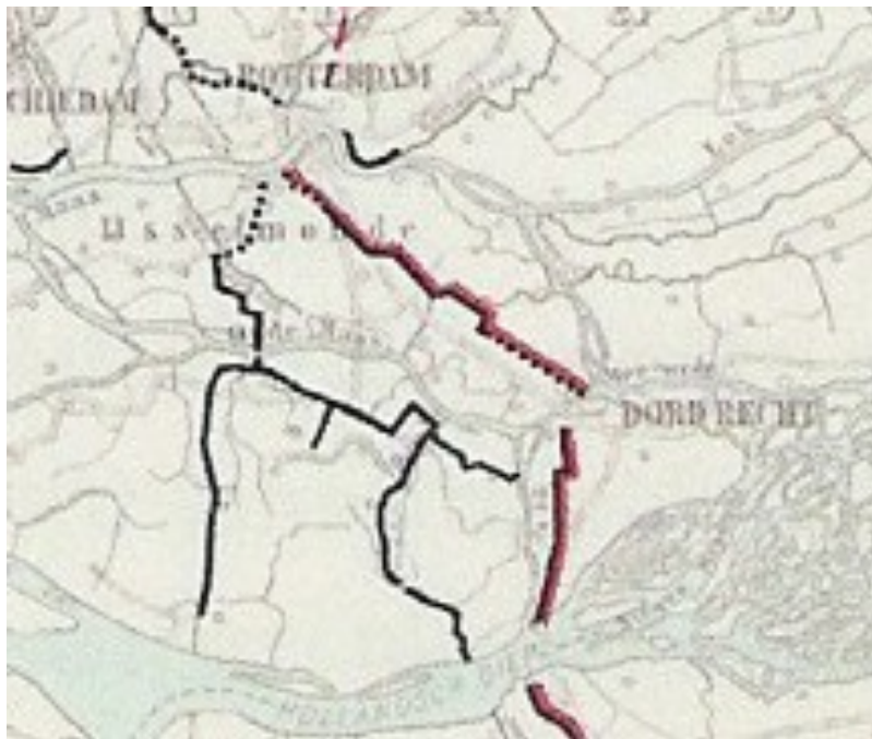
Afbeelding 6: Rijkswegen door de Hoeksche Waard (1915)

Deze weg ontmoet bij Goidschalxoord de route komende uit Numansdorp en gaat dan verder via het Rhoonse Veer naar Katendrecht. Deze structuur blijft lang behouden zoals te zien op een kaart uit 1915 (afbeelding 6). Ondertussen is in 1888