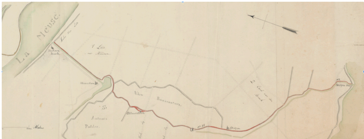
Afbeelding 4: Schets ('Esquisse') voor het traject Strijen-Sas naar Puttershoek 1810-1813

In het Nationaal Archief vonden we daarnaast het 'Plan voor de bestrating van de weg nr. 1 in het département van de Monden van de Maas tussen Rotterdam en Strijense Sas. Kaart van het tracé Puttershoek naar Strijen. [1810-1813]'.