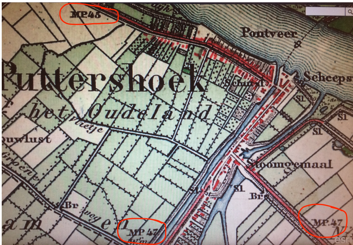
Afbeelding 7: Mijlpalen (MP) 45 en 47 (2x) bij Puttershoek (1881)

Elke kilometerpaal is aan vier zijden voorzien van een kilometeraanduiding bestaande uit 2 cijfers. Deze geeft de afstand tot provinciehoofdstad Den Haag aan. De palen zouden in 1857 zijn ontworpen door Rijkswaterstaat. Fabrikant is mogelijk de ijzergieterij 'De Prins van Oranje' (1840-1897, Den Haag), aangezien hetzelfde model voorkomt in de fabriekscatalogus van 1870. Kosten destijds: 25 gulden per paal. Er zijn nog een aantal palen bewaard gebleven in Den Haag ( Leidsestraatweg , 1861) en ook langs de Vliet tussen Leiden en Delft (1893). In de Hoeksche Waard staan ze ingetekend als MP (Mijlpaal) op kaarten uit 1881. De 'Nederlandse Mijl' was in die tijd een synoniem voor de kilometer. Op oudere stafkaarten uit 1850 zijn dezelfde getallen ook al terug te vinden (maar dan met de aanduiding P l , wat volgens de legenda ook 'mijlpaal' betekent). Daarmee is natuurlijk niet gezegd dat de huidige palen er toen ook al stonden.