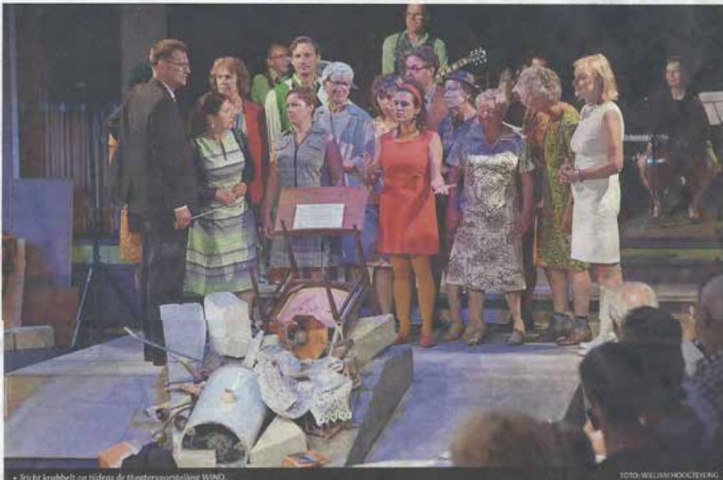
• Tricht krabbelt op tijdens de theatervoorstelling WIND.