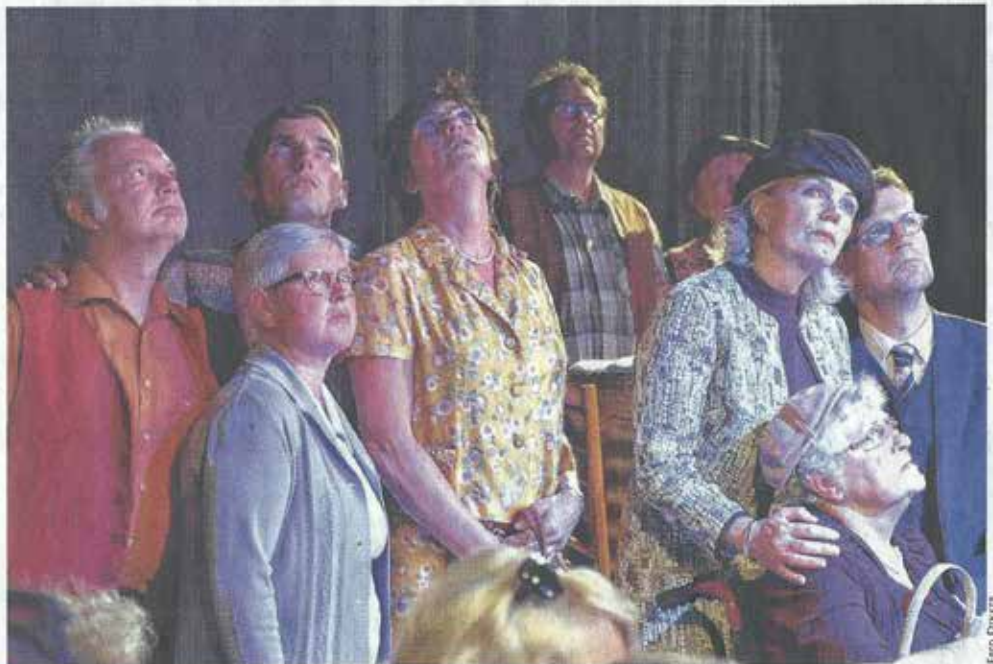
Acteurs, regisseur en musicanten van WIND! zorgen voor een ontroerende en indrukwekkende voorstelling.

In de Foyer van het Dorpshuis waan je je in de jaren zestig. Met zoveel herkenbare gebruiksvoorwerpen uit en foto's van die jaren zestig en de top 40 muziek van 24 juni 1967 uit de luidsprekers. „Ik had echt het gevoel terug te zijn in 1967,” aldus een van de bezoekers die zowel het theater als de expositie roemt. „ Dank voor al het werk wat heeft geleid tot een mooi geheel.” En veel werk was en is het. Alles naar aanleiding van het feit dat het zondag 25 juni 50 jaar geleden is dat het dorp Tricht door een vernietigende windhoos getroffen werd. Dit wordt op meerdere manieren herdacht. Dorpshuis Tricht en Productiehuis Firma van Gelder zijn verantwoordelijk voor de theaterproductie. Het Historisch Genootschap Tricht voor de officiële herdenking op 25 juni. Samen werd de tentoonstelling bedacht en ingericht met hulp van velen zoals het KNMI in de Bilt en financieel mogelijk gemaakt dankzij subsidies en sponsoren. De foto's scherpen het geheugen van bezoekers. „Nou bedenk ik me weer daff” en zo komen de gesprekken van bezoekers met elkaar op gang. Verhalen van zij die de ramp meemaakten vormden ook de inspiratie voor het