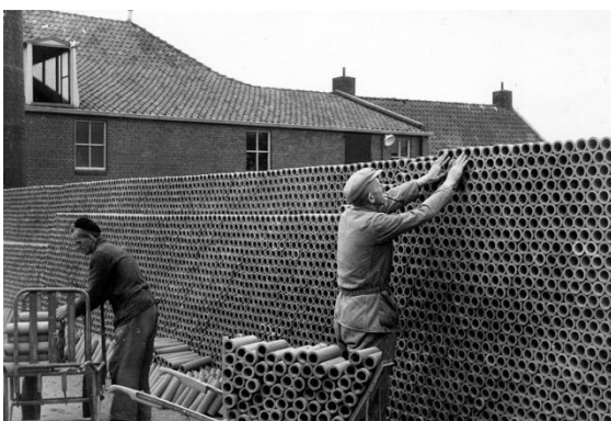
Hier kan je zien hoe het eindproduct wordt opgeslagen.