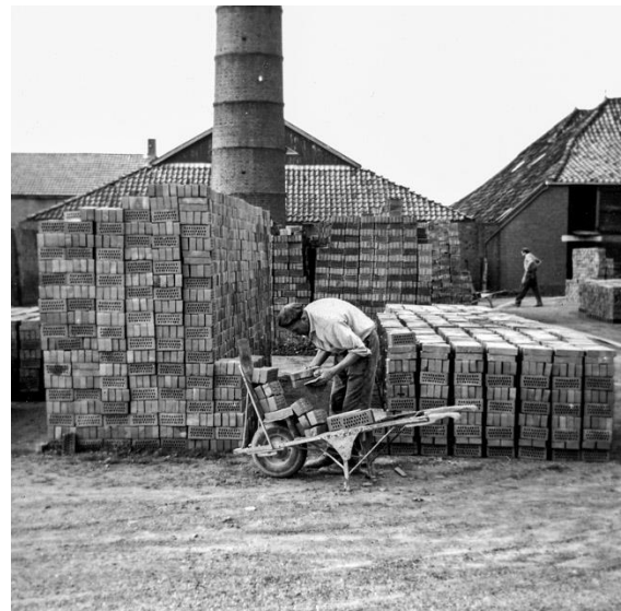
Hier wordt een ander eindproduct opgestapeld en klaar gemaakt voor transport.