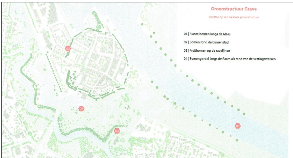
De historische boomgaarden aan de noordzijde en zuidwest van het centrum