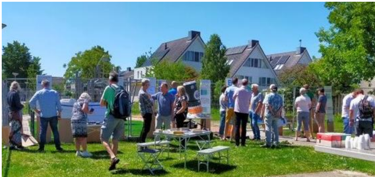
Markt Isoleren en ventileren

Goed bezocht en gezellig met een drankje van de bewonersvereniging bijpraten en ervaringen uitwisselen. Bij de diverse informatiestands was er van alles te horen en te zien. Meedoen met Energie-C, introductie EARN-E, type vloerisolatie en diverse soorten isolerend glas HR++(+), elektrisch koken en LED verlichting, soorten tochtstrips, radiator ventilatoren en radiatorfolie. Warmteterugwinning van douchewater etc. Er waren folders van de beurs 'Huis en Energie' en er waren voorbeeldmaterialen en folders door diverse bedrijven en organisaties geleverd met dank aan Energie-C, gemeente Midden Delfland, Gamma, Bauhaus, Lierglas, Earn-E en Itho-Daaldrop.